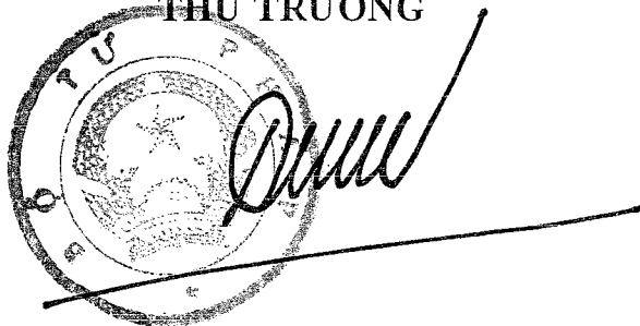
Đinh Trung Tụng